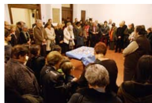
El culte es va acabar a l'atri, amb una pregària