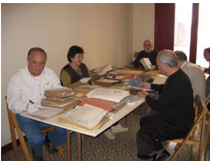
En plain travail