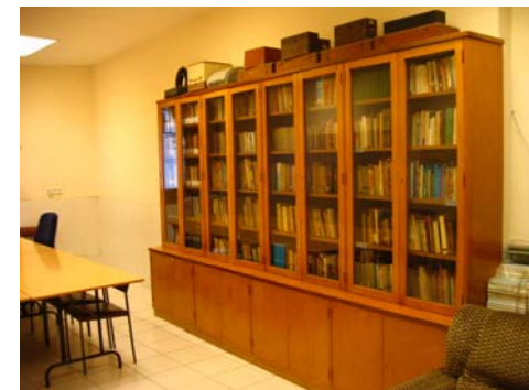
Ubicació prévu per á l' arxiu