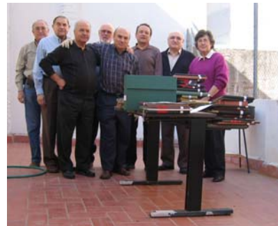
L'équipe de travail

L'importance et l'impacte spirituel et social des communautés méthodistes en Espagne, peu connu du peuple qui nous entoure, et l'urgente nécessité de récupérer la mémoire historique de nos communautés, petites, mais se battant sans cesse pour la liberté sociale et politique de notre peuple, nous a amené à essayer de rassembler et archiver les documents et manuscrits existants pour les mettre à la disposition des érudits et personnes intéressées au fait sociologique du protestantisme dans notre pays.