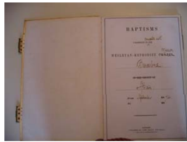
Enregistrement de baptêmes