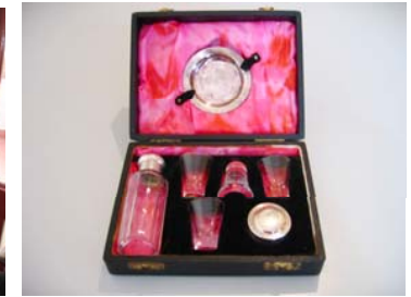
Equipo Sta. Cena portátil