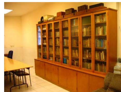
Ubicación prevista para el archivo